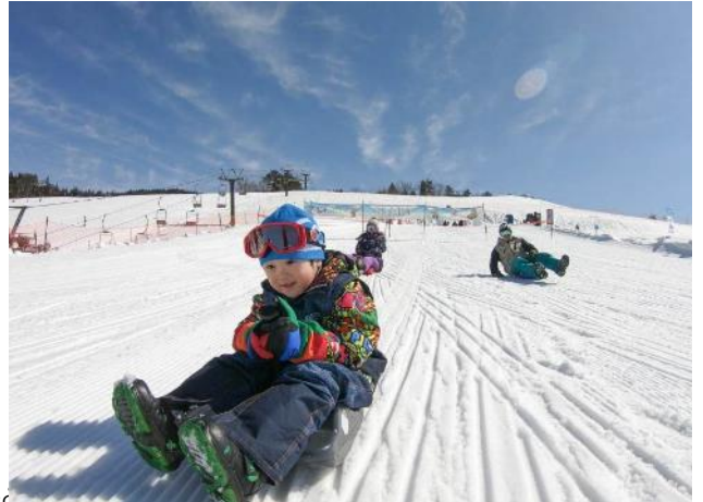
เด็กที่เล่นสกีและเล่นสเลดของคณะครูและนักเรียนโรงเรียนอัสสัมชัญ จังหวัดเชียงใหม่ เมื่อเดือนมีนาคม พ.ศ. 2566

พักที่ HASHIDATE BAY HOTEL หรือเทียบเท่า